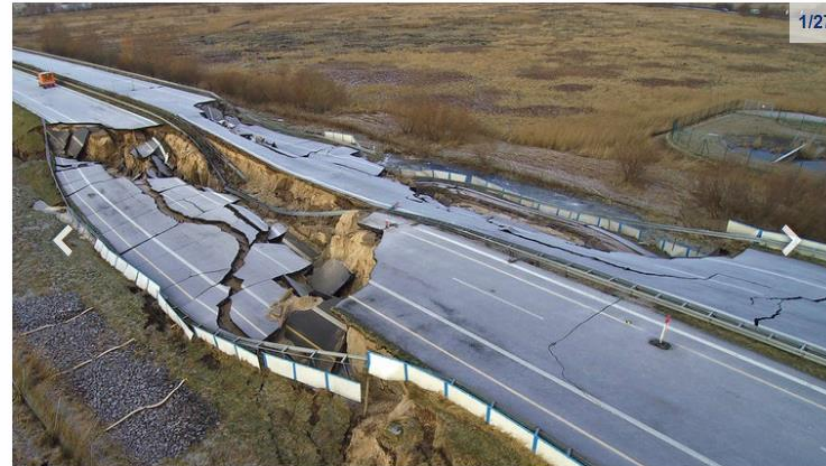
Ein tiefer Krater in der A 20 bei Tribsees erregt seit Herbst 2017 die Gemüter.